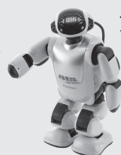
コミュニケーションロボット